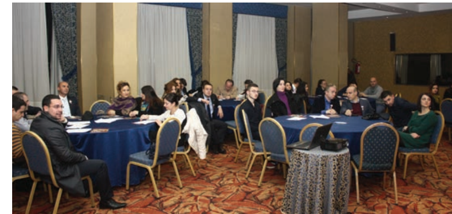
Fotot nga takimi i dytë vjetor i rrjetit alumni

Ecuria përgjatë vitit 2015 e vendit tonë në zbatimin e prioriteteve drejt integritimit evropian. Diskutim mbi fazat e pritshme