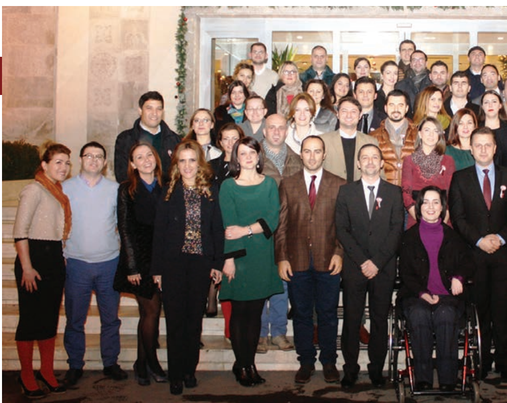
TAKIME TË PËRMUAJSHME PËR TË DISKUTUAR MBI REFORMAT DHE TEMAT E AKTUALITETIT POLITIK

Ky organizim i ri do të nisë gjatë vitit 2015 me një kalendar të përcaktuar mbi disa reforma dhe tema të rëndësishme me të cilat përballet vendi. Është planifikuar që takimet të organizohen fillimisht me një periodicitet njëmuajor, përgjatë të enjtes së fundit të muajit, në formatin e një takimi në rregullat e "Chatham house". Ky rregull përcakton se pjesëmarrësit janë të lirë të përdorin informacionet e marra gjatë diskutimeve, por duke mos bërë pub-